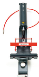
SEFAR 2 / 150