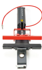
SEFAR 2 / 250