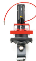
SEFAR 2 / 150